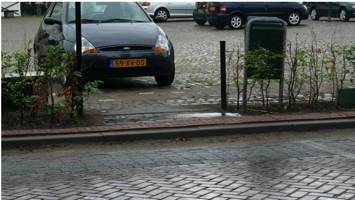
Foto 1 Doorsteek in beukenhaag